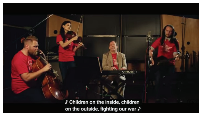
♪ Children on the inside, children on the outside, fighting our war ♪

Svako je slep sve dok ne progleda i niko ne može biti slobodan sve dok postoji ropstvo. Koristi svoju glavu i srce, vreme je da uradimo svoj deo, dajmo deci iz celog sveta novi početak. Dajmo deci iz celog sveta novi početak. Dajmo deci iz celog sveta novi početak. https://www.youtube.com/watch?v=qHNgfStLwNc