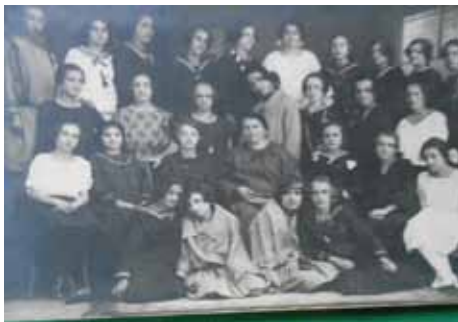
III RAZRED ŽENSKE UČITELJSKE ŠKOLE