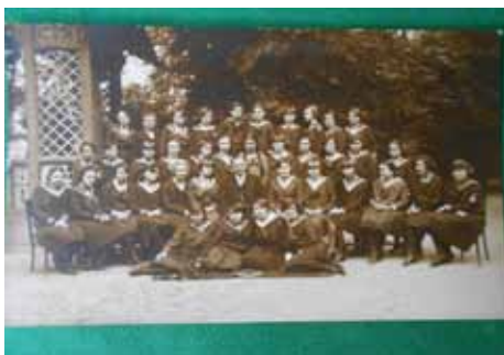
II RAZRED ŽENSKE UČITELJSKE ŠKOLE

Druga karakteristika tog perioda, pa i kasnije, bila je velika nestalnost nastavnika i veoma česte promene. Ne retko se jedan nastavnik u toku školske godine dva puta premešta (npr. Jovan Milošević je novembra 1934. godine dodeljen na rad u Učiteljsku školu u Negotinu, a aprila je već premešten u Učiteljsku školu na Cetinju), ili se po službenoj potrebi premeštaju nastavnici iz ove Škole u Sarajevo ili Karlovac, a odande u ovu Školu, a još češći slučajevi su bili da se nastavnik premešta u somborsku Gimnaziju, a odande nastavnik iste struke u ovu Školu. U ovakvim uslovima nastavnike nije brojna su dopunjavanja nastavnika Gimnazije u ovoj školi, a rede i obrnuto.