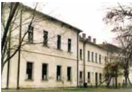
ŽENSKA UČITELJSKA ŠKOLA