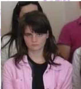
grupa vaspitača i učenika SOSO „Yuk Karadžić“ sa domom Sombor