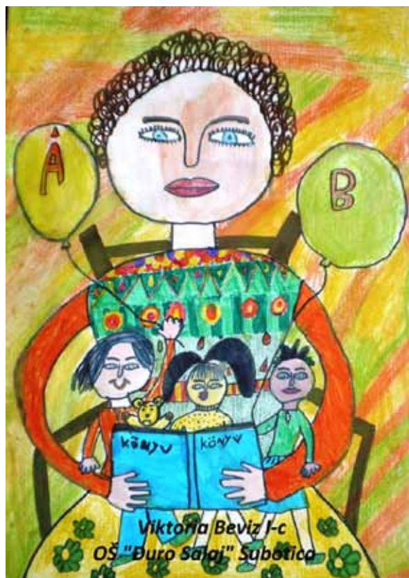
Viktorija Beviz I-c OŠ "Đuro Salaj" Subotica