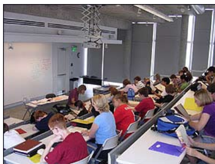
U obrazovanju nema dovoljno jednakosti polova, tvrdi se u izveštaju

Četiri najuspešnije zemlje, kada je reč o polnoj ravnoteži, bile su Estonija, Bugarska, Grčka i Rumunija, u kojima žene čine više od 40 odsto svih diplomaca iz matematičkih, prirodnih i tehničkih nauka. Taj odnos je najviši u zemlji kandidatu za EU članstvo, Makedoniji, sa 46,9 odsto u 2005. godini.