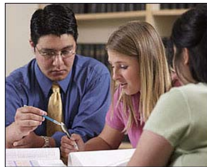
Broj diplomaca iz matematičkih, prirodnih i tehničkih nauka porastao je za 25 odsto od 2000. godine

"Sticanje osnovnih kvalifikacija je prvi korak za učešće u društvu zasnovanom na znanju", napomenula je EK u oktobru. "Međutim, sa 15 godina starosti, oko milion od pet miliona učenika u EU postiže slabe rezultate kada je reč o čitanju i pismenosti."