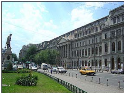
Samo 1,3 odsto radno sposobnog stanovništva u Rumuniji učestvuje u obrazovanju i obuci

Članice EU ostvarile su samo jedan od pet ciljeva u obrazovanju koje je EU postavila do kraja decenije. Napredak u ispunjenju preostalih ciljeva je limitiran, zaključila je Evropska komisija u nedavnom izveštaju.