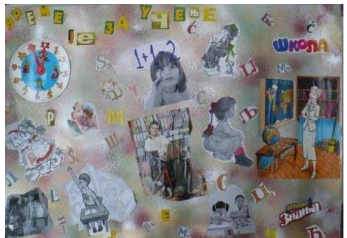
„Vreme je za učenje“, Grupni rad učenika SOSO „Vuk Karadžić“ sa domom, Sombor