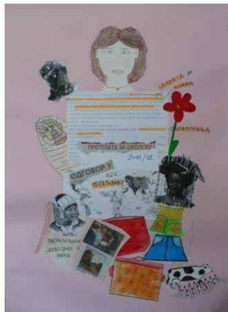
„Odgovor je u obrazovanju“, Grupni rad učenika VI razreda OŠ „Ognjen Prica“ Kolut