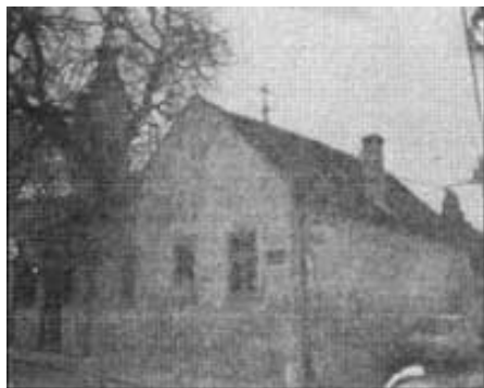
Prva srpska škola u Zemunu, Njegoševa 45